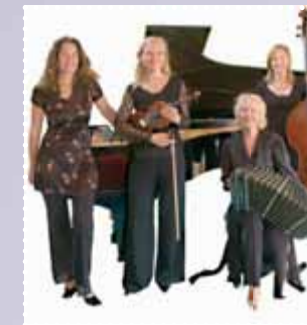
Tango Rosa Rio